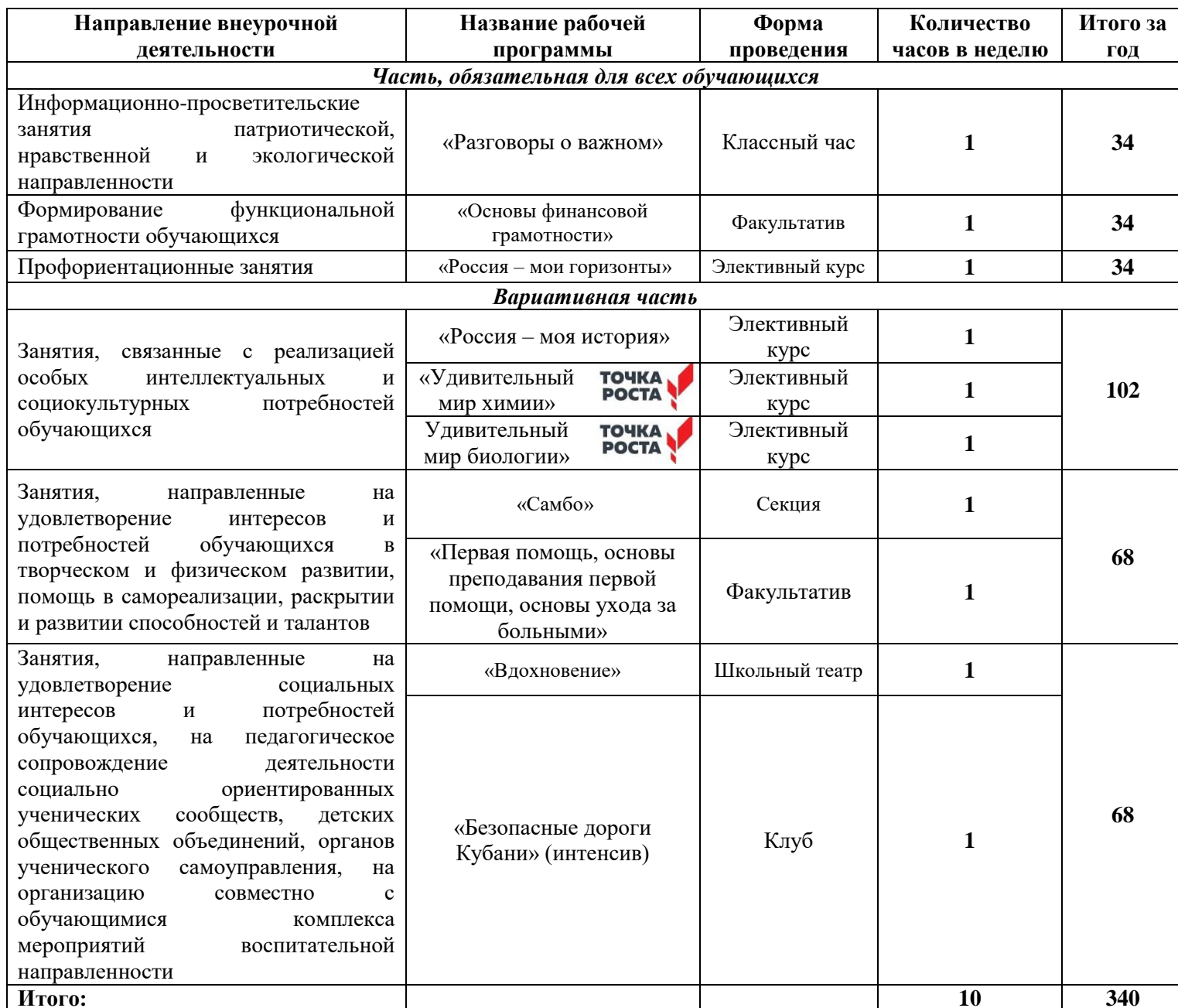
Таблица-сетка часов учебного плана внеурочной деятельности МБОУ СОШ № 10 имени В. Ф. Маргелова поселка Степной муниципального образования Кавказский район для 10 класса, реализующего федеральный государственный образовательный стандарт среднего общего образования на 2023– 2024 учебный год.